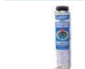
LeierFIX univerzális építési ragasztó