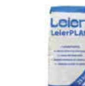
LeierPLAN vékony falazóhabarcs